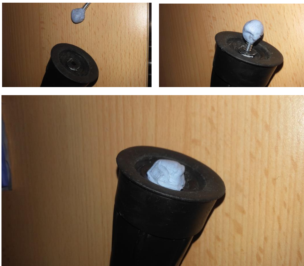
Elaboración de la adaptación.